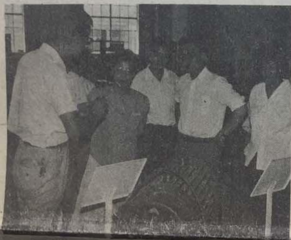
北京长城机电集团公司研制的调速电机的模型。

“长城”旋风骤然刮起，连日里，首都各大新闻媒体大幅刊登和播映着“长城”系列广告，广告上赫然写道：“美有通用，我有长城。长城宗旨：创造贡献；长城目标：跨国集团。”广告内容是“关于扩大企业集团联合生产销售调速电机及调速机械装备的公告”，公告中一下子列出企业急需的多种型号新产品专利260余项。与此同时，他们还连续召开和举办了各种新闻发布会和产品展示订货会。仅1990年8月10日至13日，在北京龙都宾馆举办的一次交流调速电机技术产品展示订货会上，全国各地200余家企业代表到会观看了现场演示，订货量高达60多万千瓦，价值3亿多元。机电部第一装备司副司长林昭奎在会上讲话时说：“长城